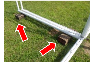
角材の上におせる