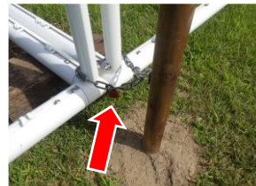
2個一緒に真ん中の杭にチェーンで固定し南京錠