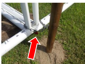
チェーンで固定し南京錠