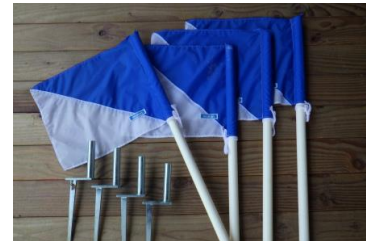
コーナーフラッグ 4 本（専用杭）

※利用者が多い期間中のネットはつけたままにしていますが、時期と場合によって取り付けと取り外しをお願いする場合がございますので、管理人の指示に従ってください。