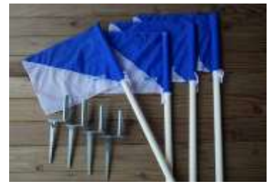
コーナーフラッグ 4本 (専用杭)

※ 利用が多い期間中のネットはつけたままにしていますが、時期と場合によって取り付けと取り外しをお願いする場合がございますので、管理人の指示に従ってください。