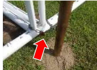
チェーンで固定し南京錠